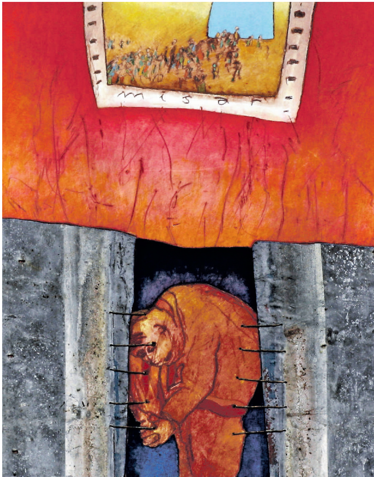
Misar - psalm 42 van Henk Pietersma.